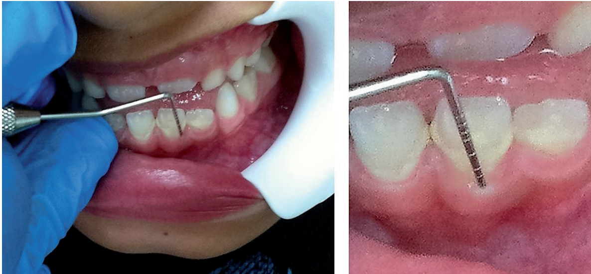
Fig. 4 Sondaje para determinar enfermedad periodontal

Conclusiones La literatura reportó que en los adolescentes la inflamación se presenta superficialmente, sin embargo puede ocurrir una alteración en el equilibrio entre el huésped y ambiente microbiano resultando en una pérdida de inserción. Modificado por factores genéticos que modifican la respuesta del huésped a la agresión bacteriana, además de las enfermedades sistémicas. De lo que se desprende la validez y las ventajas de los índices empleados en los estudios epidemiológicos, en la evaluación de la enfermedad periodontal y las necesidades de tratamiento en niños y adolescentes.