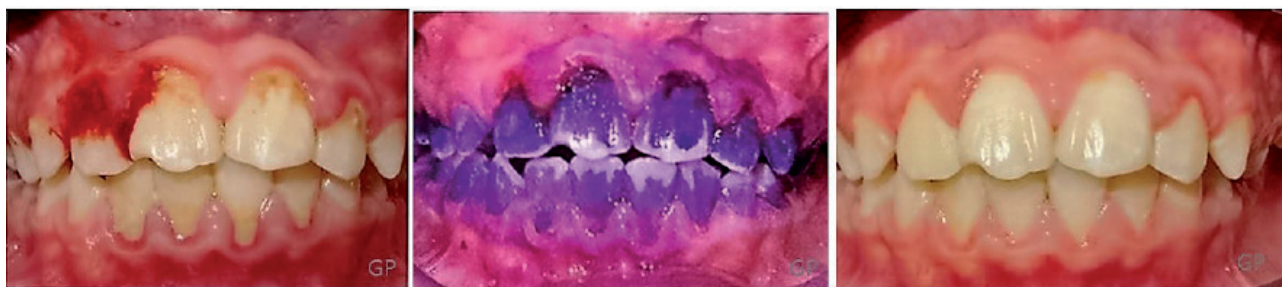
Gingivitis del adolescente: evaluación inicial, detección de placa bacteriana, control 7 días después de profilaxis y cepillado dental diario

En la dentición mixta y ya en la adolescencia, el apiñamiento dental suele llevar a una mayor incidencia